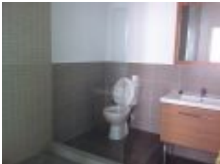
san bernardo 8 006.jpg